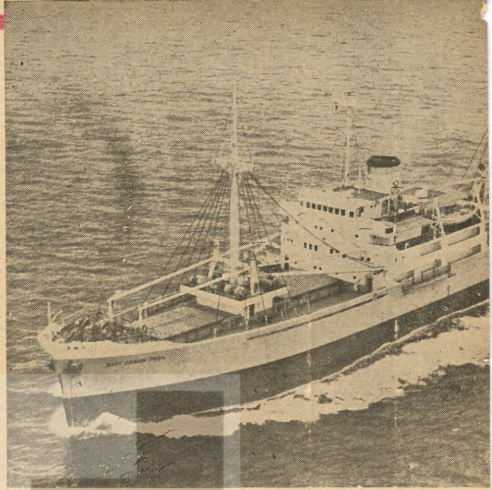
Deniz Nakliyatı'nın Gazi Osman Paşa şilebi

2) Millî savunma hizmetleri için hükümetin özel sektörden apar topar gemi istediği görülmemiştir. Kıbrıs'a çıkartma sözü dolayınca, hep kamu